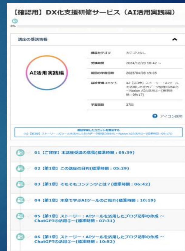
プラットフォームイメージ