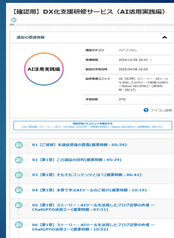
プラットフォームイメージ