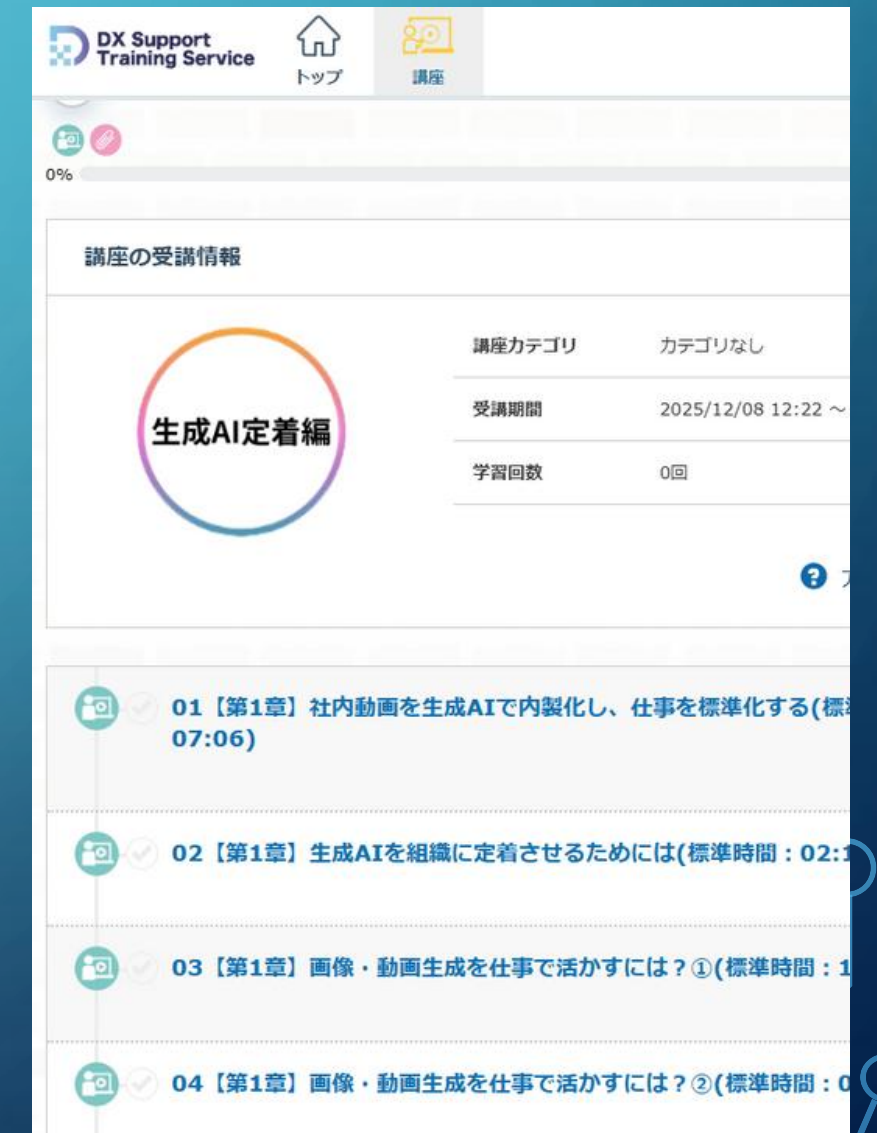
プラットフォームイメージ